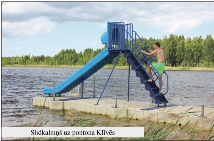
Slidkalniņš uz pontona Klīvēs