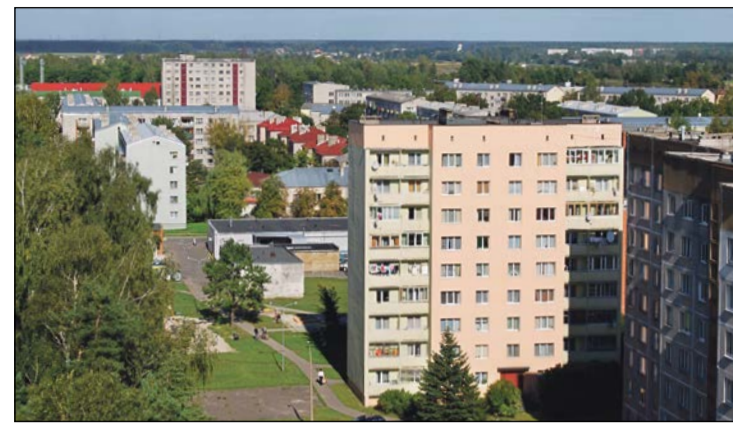
Dzīvojamais fonds (daudzdzīvokļu mājas) Olaines novadā (Olaines pilsētā un Olaines pagasta teritorijā)