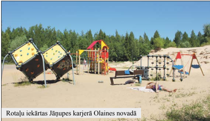
Rotaļu iekārtas Jāņupes karjerā Olaines novadā

• Šā gada jūlijā XI Latvijas Skolu jaunatnes dziesmu un deju svētkos Olaines novadu pārstāvēs 352 dalībnieki. Esam priecīgi, ka svētkos piedalīsies Jaunolaines Kultūras nama bēr-