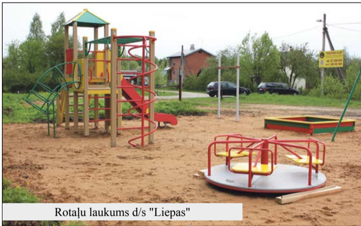
Rotaļu laukums d/s "Liepas"

nu deju kolektīvs "Pienenīte", Olaines Kultūras nama deju kolektīvs "Oļi", Olaines 1. vidusskolas tautas deju kolektīvs "Dzērve", Olaines 2. vidusskolas deju kolektīvs "Dzērvene", Olaines pirmsskolas izglītības iestādes "Dzērvenīte" deju kolektīvs, Olaines Mūzikas un mākslas kamerorķestris, Olaines Mehānikas un tehnoloģijas koleģijas jauniešu koris "Skandijis". Lai mūsu kolektīviem veicas!